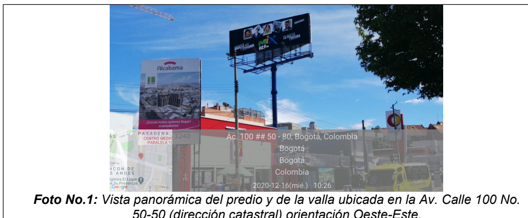
Foto No.1: Vista panorámica del predio y de la valla ubicada en la Av. Calle 100 No. 50-50 (dirección catastral) orientación Oeste-Este.